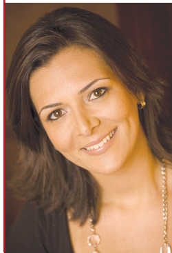
por Emanuelle Missura